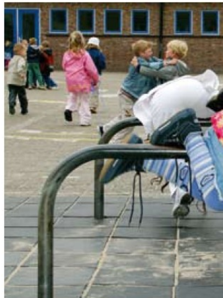
ADHD-medicatie is geen kinderspel.

De eerste studie toont een verslavend effect van methylfenidaat bij muizen, vergelijkbaar met cocaïne [1]. De andere studie meldt het optreden van psychoses en manieën bij met psychostimulantia behandelde ADHD-