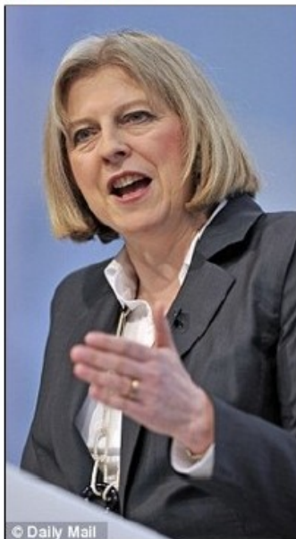
'Enough is enough': Home Secretary Theresa May has warned of the dangers of the ADHD drugs

For instance, one family in the West Midlands has two children receiving medication for ADHD. They get £600 a month in disability allowances for each of the two children who have been diagnosed with the ailment.