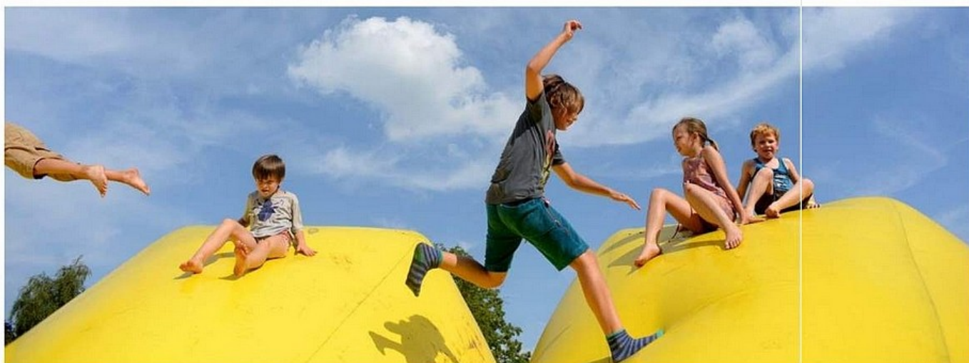
Ouders moeten hun kinderen aansporen om buiten te spelen, vindt het WIV.

WETENSCHAPPELIJK INSTITUUT VOOR VOLKSGEZONDHEID BECIJFERT HOE WEINIG WE BEWEGEN