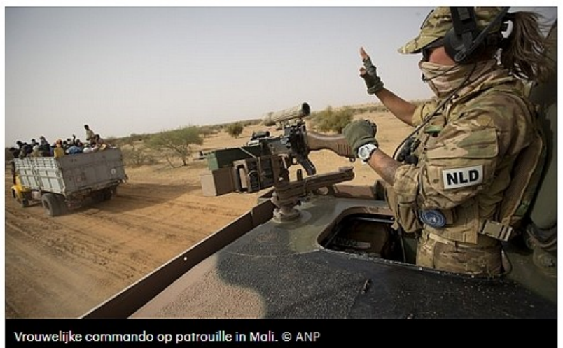
Vrouwelijke commando op patrouille in Mali.